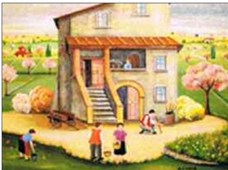
Zenone (Emilio Giunchi)