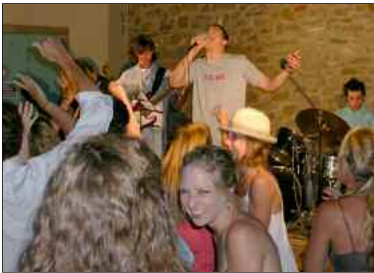
I gruppi "elettrici" durante la serata Rock del 14 giugno in Piazza della Seta a Cortona