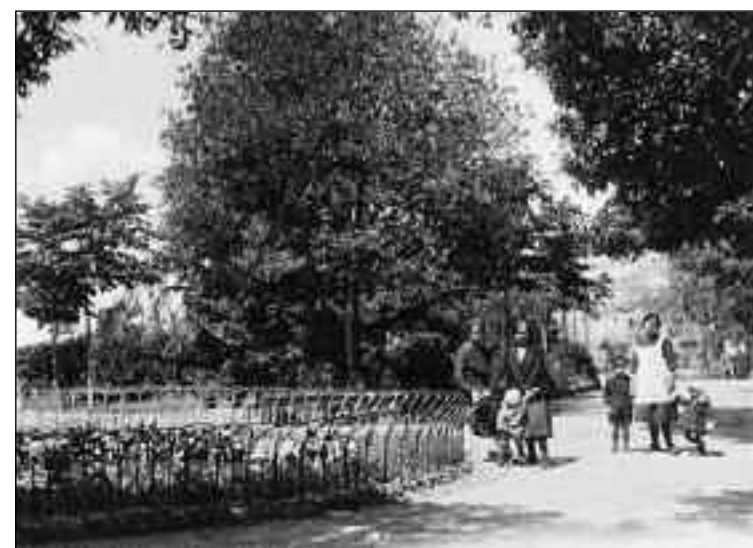
Cortona, Parterre 1930