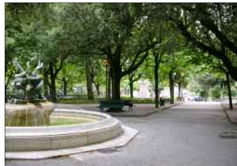
Cortona, Parterre 2009.