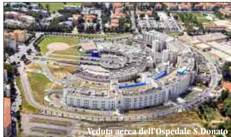
Veduta aerea dell'Ospedale S. Donato