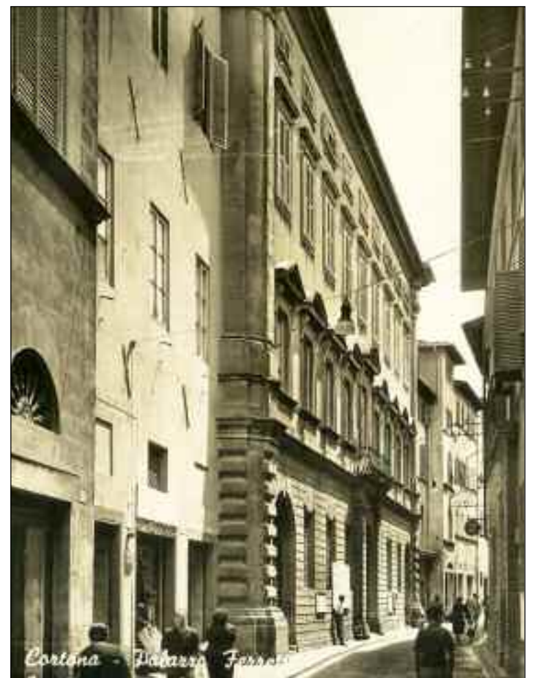
Cortona, Via Nazionale, 1950 circa.