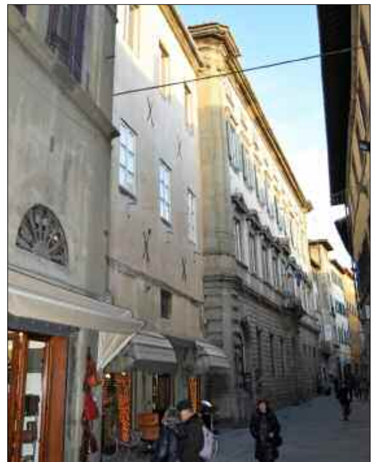
Cortona, Via Nazionale, 2010.