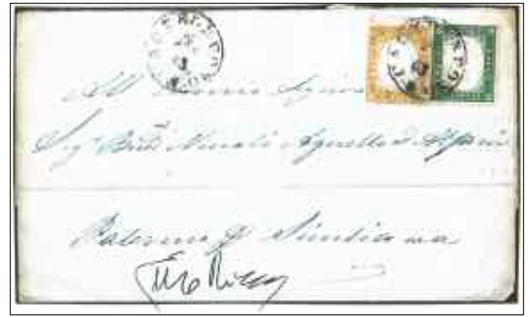
Italia 1863 - 1 franc.: il 5 cent. degli Stati Sardi del 1855; 1 franc.: il 10 cent. d'Italia. Annullati con bollo "Sardo Italiano".

Anche in filatelia, con i dovuti distinguo, i Collezionisti, e gli ad-