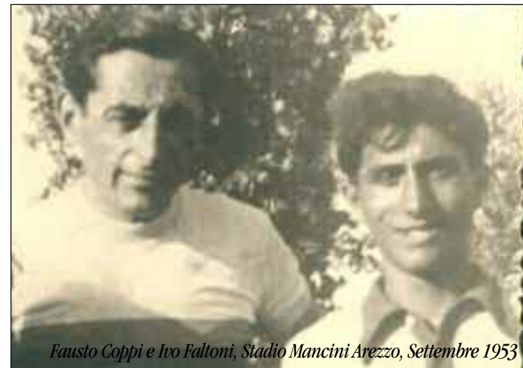
Fausto Coppi e Ivo Faltoni, Stadio Mancini Arezzo, Settembre 1953

Quasi alla fine del 1959 Gino Bartali volle che anche io intervenessi alla presentazione della squadra San Pellegrino per l'anno successivo. Eravamo, appunto, a questa manifesta-