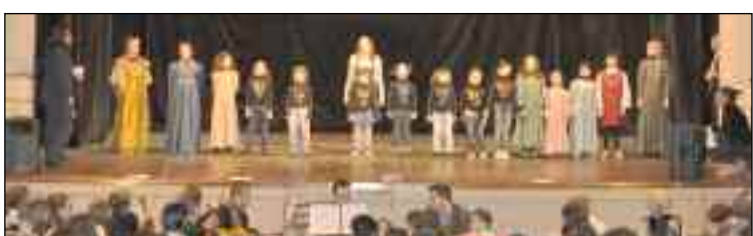
Il musical "Viaggio intorno alla Musica", con i "Piccoli al Piccolo" e l'Orchestra dei giovani allievi della Scuola di Musica Comunale di Cortona (Foto Alvaro Ceccarelli).