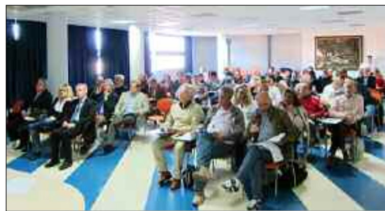
I partecipanti al convegno.

anziani ne soffrano, e che gli stessi lamentino al contempo patologie croniche tipiche dell'invecchiamento, aggrava un quadro complesso di "fragilità" che contraddistingue il soggetto anziano, andando a costituire una vera sin-