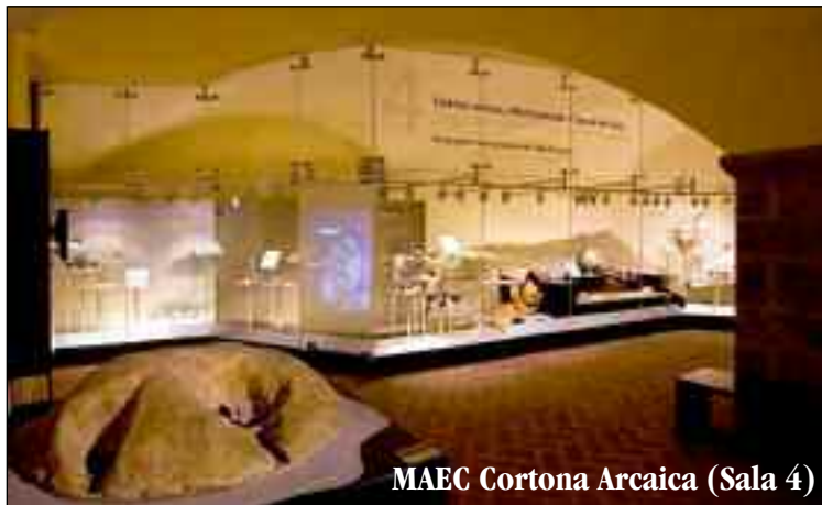
MAEC Cortona Arcaica (Sala 4)

del MAEC, e presenterà circa 50 pezzi straordinari della collezione etrusca del Louvre, opere mai esposte in Italia.