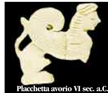
Placchetta avorio VI sec. a.C.