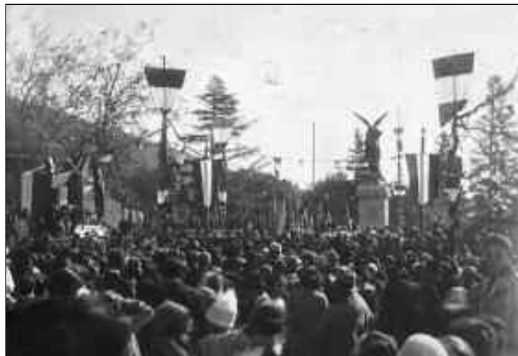
Cortona, 11 ottobre 1925. Cerimonia per l'inaugurazione del monumento ai Caduti cortonesi nella Grande Guerra..

Dunque, la furia della guerra fece morire tanti sfortunati concittadini a migliaia di chilometri da Cortona (i più fortunati nell'ospedale di Cortona o nel manicomio di Arezzo), lontano dai familiari che non poterono neppure piangere sui loro corpi martoriati, abbandonati su ignote trincee, nei