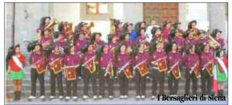
I Bersaglieri di Siena