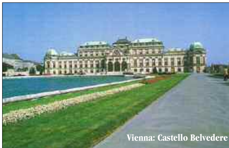
Vienna: Castello Belvedere

Quota di partecipazione per persona 290,00 euro e comprende: Viaggio in Bus GT, due pernottamenti e prime colazioni a Buffet in Hotel 4 stelle nel centro di Vienna, cene in ristoranti tipici.