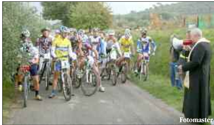
Il parroco di Ossaia che benedice di partecipanti

E' uno degli ultimi appuntamenti per adepti di questo sport,