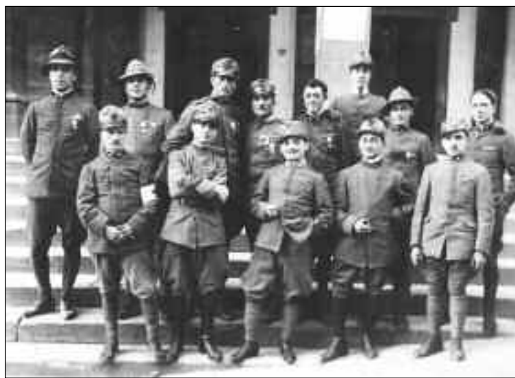
Cortona, 1 novembre 1921. Ex combattenti cortonesi sulla scalinata del Teatro Signorelli, di ritorno dalla stazione ferroviaria di Camucia, dove era passata la salma del "Soldato Igno" diretta a Roma. (Collezione Mario Parigi).

La Liberazione fin dal 1946 ha prodotto polemiche ancora non superate e la stessa festa della Repubblica per qualche anno non è stata considerata festività nazionale, tant'è che veniva celebrata la prima domenica di giugno.