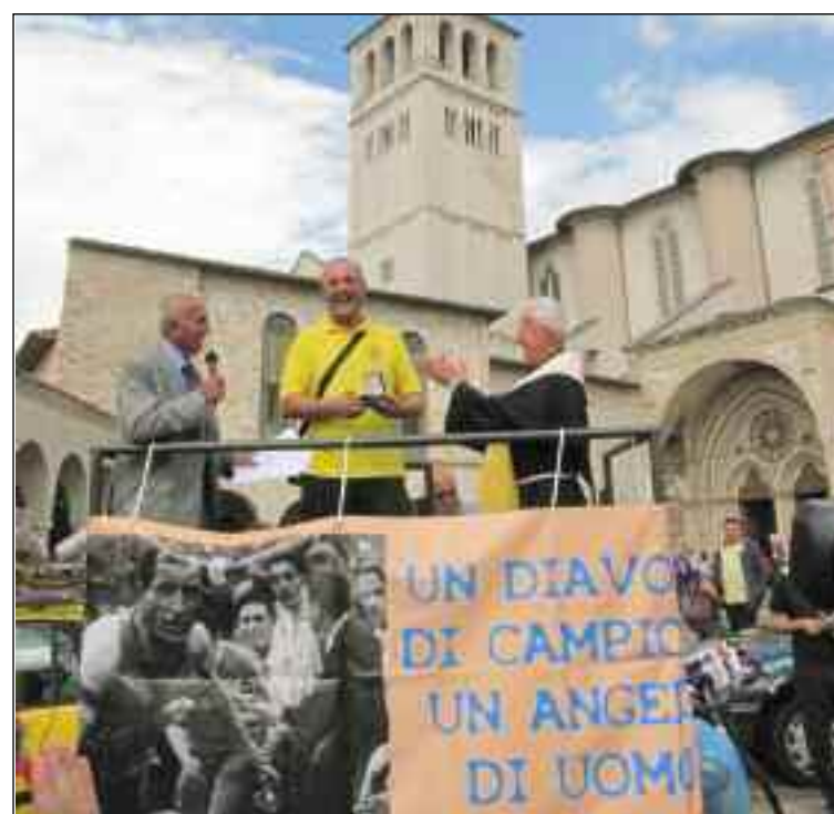
Padre Vicario della Basilica di Assisi consegna la medaglia del Presidente della Repubblica al rappresentante della prima squadra classificata Gagliarda Sambenedettese