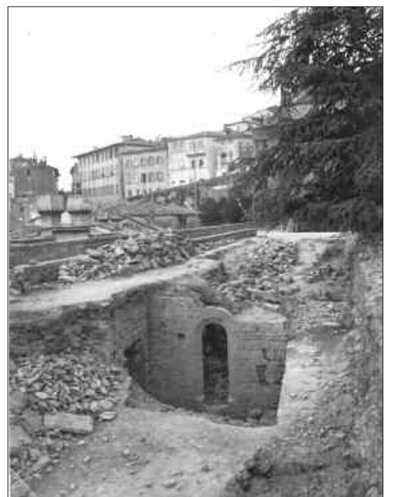
Cortona, Largo Beato Angelico, 1915/1920 circa

Approfitto della mia rubrica per un fuori programma, riproponendo dopo alcuni anni questa magnifica e originale fotografia. Pur avendo chiesto un parere a molti appassionati, non sono riuscito a datarla con sicurezza e a capire che cosa sia sepolto nei pressi della Chiesa di S. Domenico a Cortona. Si tratta sicuramente di un fabbricato, o una serie di costruzioni, di ragguardevoli dimensioni. Forse un'antica Chiesa o, come mi ha suggerito qualcuno, un edificio militare? Non so, però vedendo sulla sinistra quella porta in pietra e considerando che l'intera struttura si erge allo stesso livello del parallelo Borgo, mi vien da pensare che forse si tratta di qualcosa ad esso anticamente collegato.