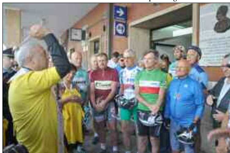
Rito religioso alla partenza del Ciclopellegrinaggio 2010

Alle ore 8.30 del 19 settembre 2010 oltre 150 ciclisti, provenienti da tutta Italia, si sono ritrovati presso la Stazione Ferroviaria di Terontola, per partecipare al Ciclopellegrinaggio Terontola - Assisi "Gino Bartali Postino per la Pace". Davanti alla stele di Gino Bartali si è svolta la