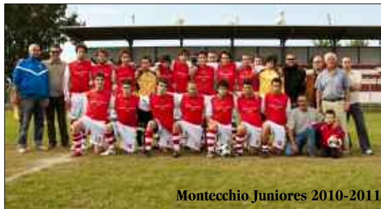
Montecchio Juniores 2010-2011