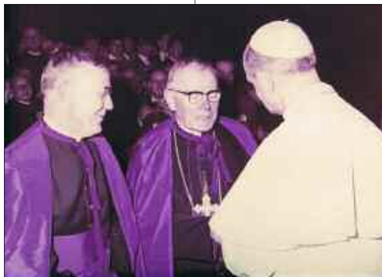
Il vescovo Franciolini con il Papa Paolo VI e mons. Guido Materazzi

Il Giornale L'Eturia è lieta di comunicare ai suoi lettori e ai cortonesi il riconoscimento conferito dalla città natale alla memoria del compianto vescovo della nostra Diocesi, mentre si augura che, nel 2014, per il 25° della morte, anche Cortona programmi iniziative che ne suggellino la edificante immagine di Pastore di anime dalla rilevante sensibilità culturale.