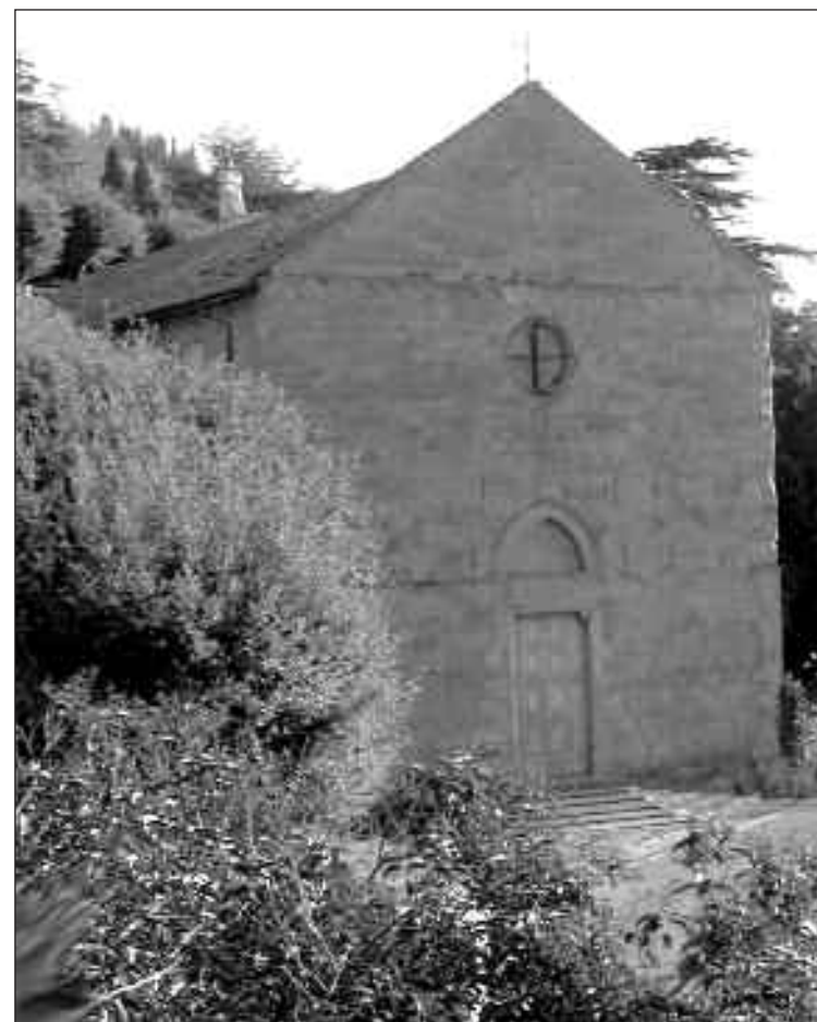
Cortona 2012. Chiesa di S. Domenico vista da via S. Margherita.