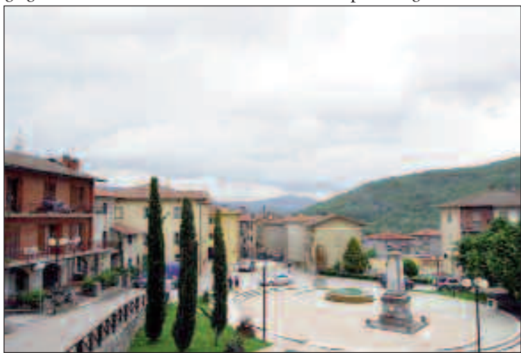
La piazza di Lisciano Niccone

Con la differenza però che mentre Lisciano è capoluogo di comune umbro, Mercatale è lontana frazione del comune cortonese, differenza che fino a pochi decenni fa non ha precluso a Mercatale la sua maggiore importanza strutturale, commerciale e d'aggregazione.