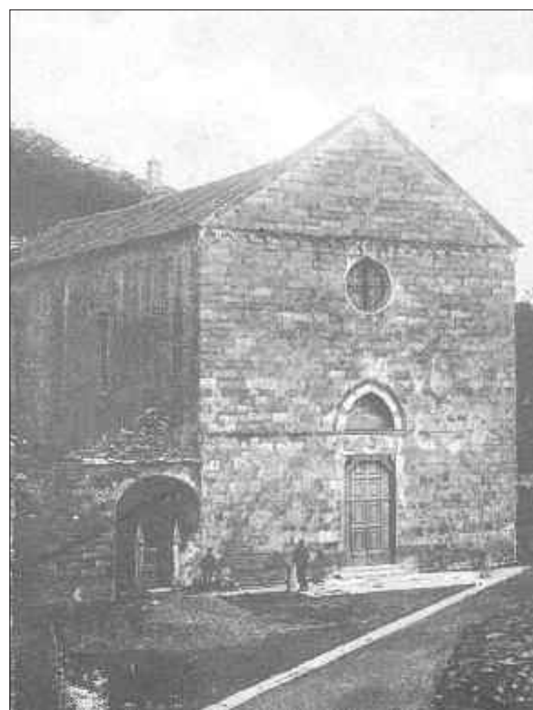
Cortona 1915. Chiesa di S. Domenico vista da via S. Margherita.