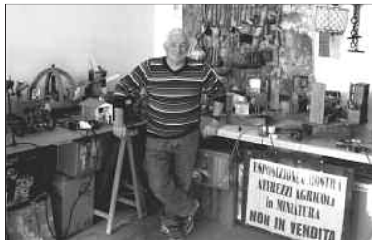
L'Artista nel suo museo

lio ha realizzato in un fondo della sua abitazione a S. Eusebio, si è arricchita negli ultimi tempi di macchinari in movimento (il frantoio, la trebbia ecc.) e della riproduzione di ambienti della vecchia casa dei contadini, dalla cucina alla camera da letto.