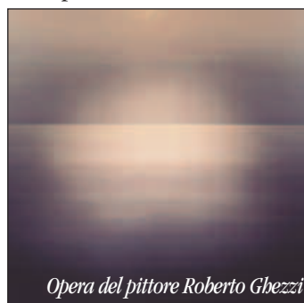
Opera del pittore Roberto Ghezzi

Nei suoi sconfinati panorami il pittore riesce a dare un Suono al Silenzio che non rimane racchiuso nelle sue tele ma si espande come una delicata Sinfonia nell'ambiente dove sono ospitate. Bravo, per me è fonte di gioia riconoscere il merito ad un giovane uomo che ha intrapreso una carriera di vita delle più difficili e meno ricono-