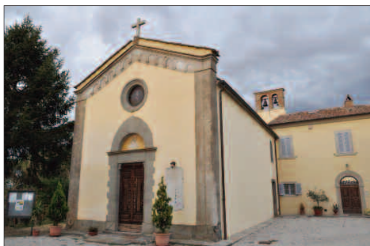
La chiesa di San Biagio a Monsigliolo