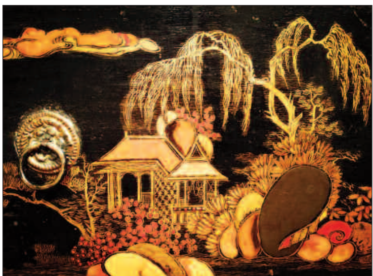
Particolare del cassetto dello stipo finemente dipinto con lacche