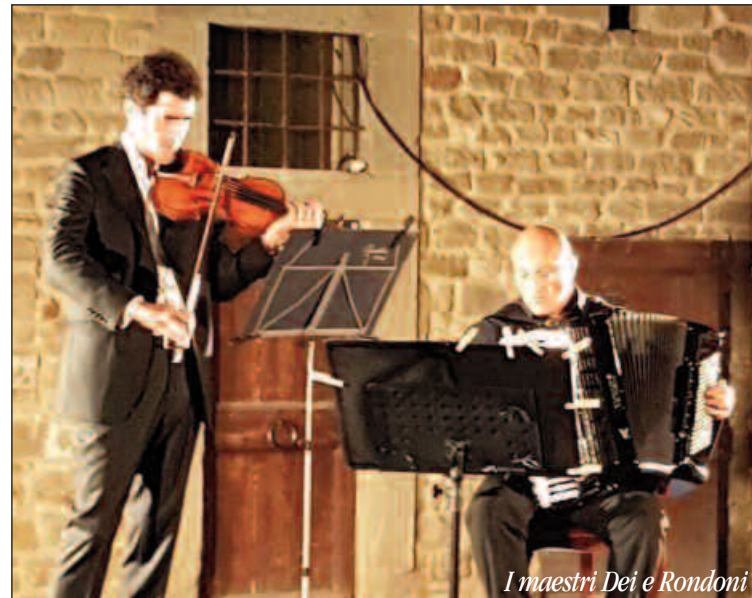
I maestri Dei e Rondoni

La melodia struggente di Libertango , forse il brano più famoso di Piazzolla, strappa applausi a scena aperta del numeroso pubblico presente e la richiesta del bis, che i due musicisti concedono volentieri.