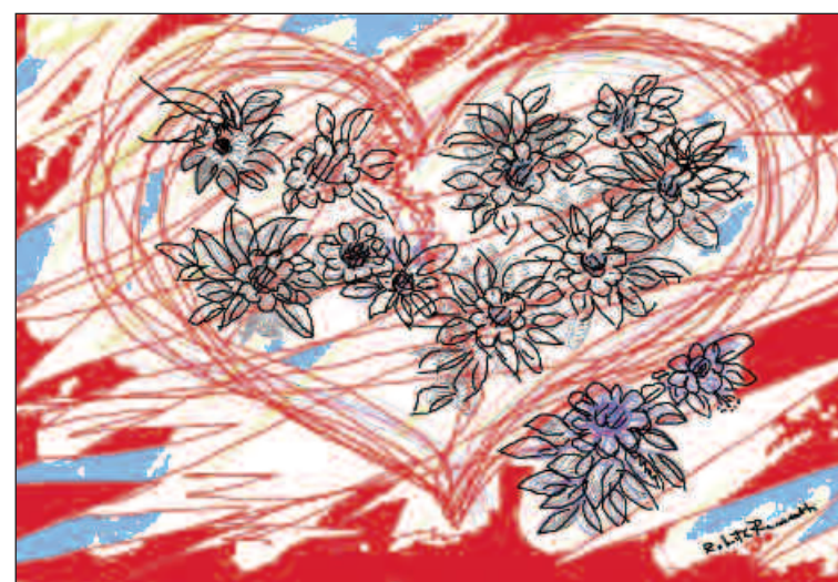
Grafica di Roberta Ramacciotti