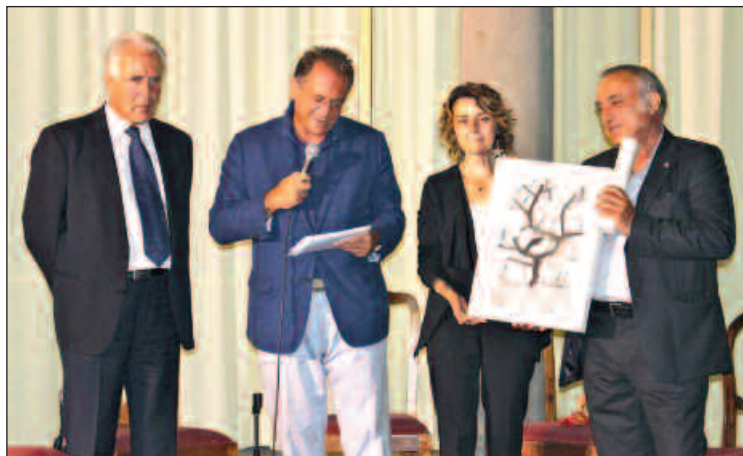
Consegna del Premio Cortonantiquaria