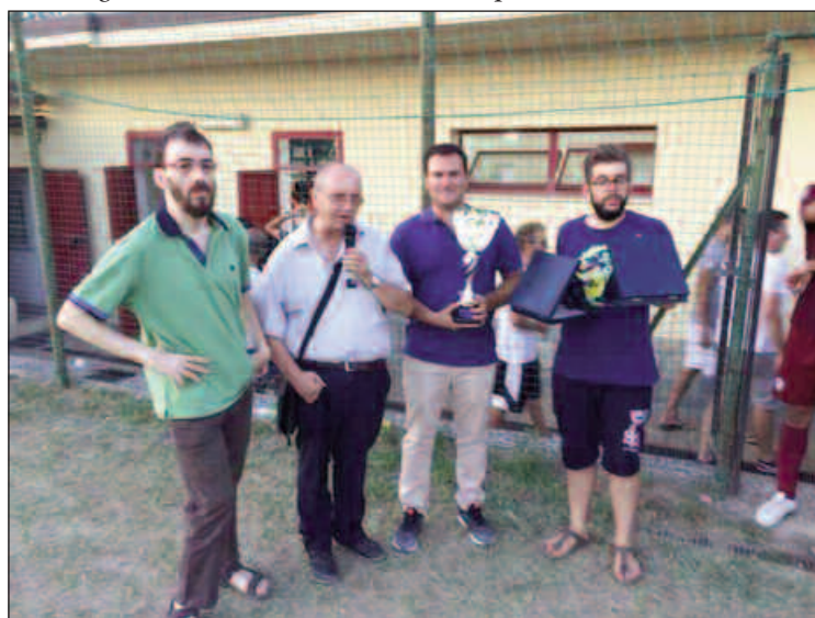
Stadio di Montecchio durante la premiazione del trofeo Ennio

Questi i quadri generali della Polisportiva Montecchio. Ci permettiamo di fare un'esortazione particolare soprattutto ha chi ha in mano le redini di questa piccola, ma gloriosa Società, che proprio in questo 2017 ha celebrato con