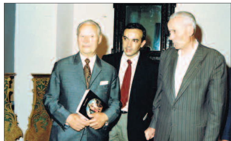
XXIX Mostra 1991 il presidente cecoslovacco Alexander Dubcek