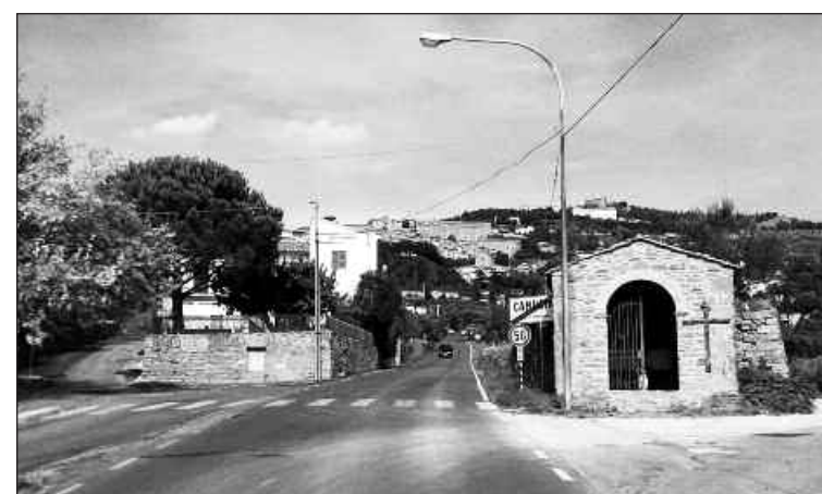
Cortona 2017. Maestà del Sasso.