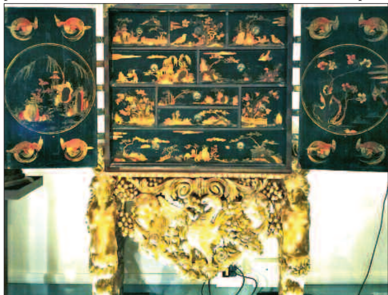
Stipo inglese dipinto con lacche orientali ed oro del Seicento in mostra all'Antiquaria.