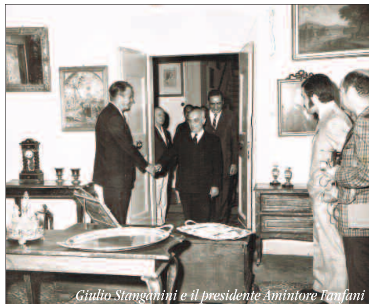
Giulio Stanganini e il presidente Amintore Fanfani

150.000 lire per l'allestimento della Rassegna presso le Stanze Civiche al Teatro Signorelli e vi parteciparono 14 espositori dei quali ben 9 erano cortonesi.