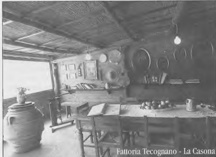
Fattoria Tecognano - La Casona

Se Traveller restituisce una terra da affresco rinascimentale, da sogno quasi, In Viaggio è rivista più adatta a suggerimenti per