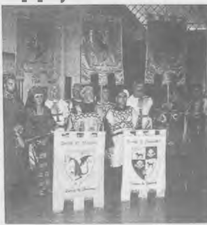
I gonfalonieri del Palio in Municipio.