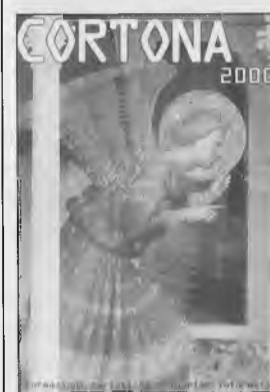
Beato Angelico - "Annunciazione" (particolare) Museo Diocesano (Cortona)

Ora tutto questo rischia di essere sommerso - o, peggio, dimenticato - in omaggio all'onda del turismo di massa il cui impatto, nell'euforia del successo, nessuno sembra aver calcolato.