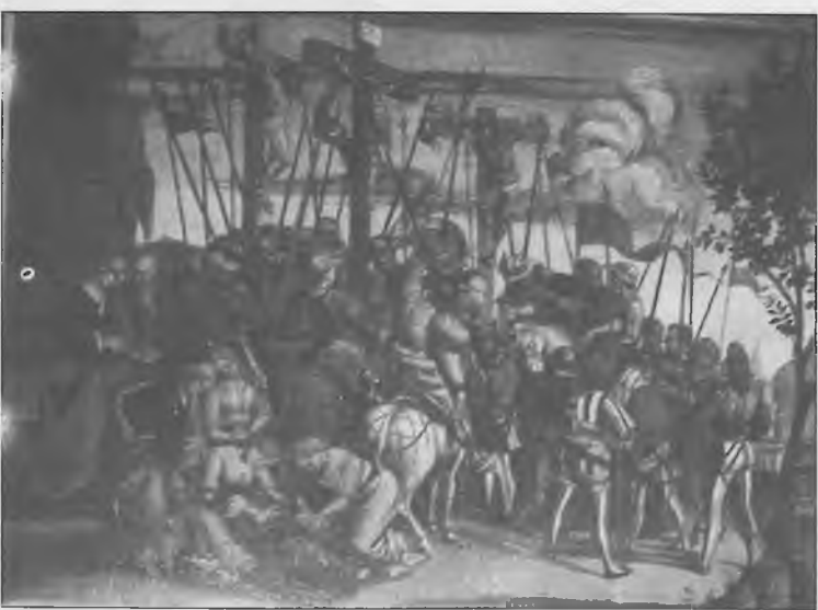
Luca Signorelli "La battaglia di San Romano" 1488-1494

Una nostra abbonata andando a trovare il figlio che risiede da tempo in America si è recata alla National Gallery of Art Washington ed ha ammirato i quadri e le opere che vi sono esposti.