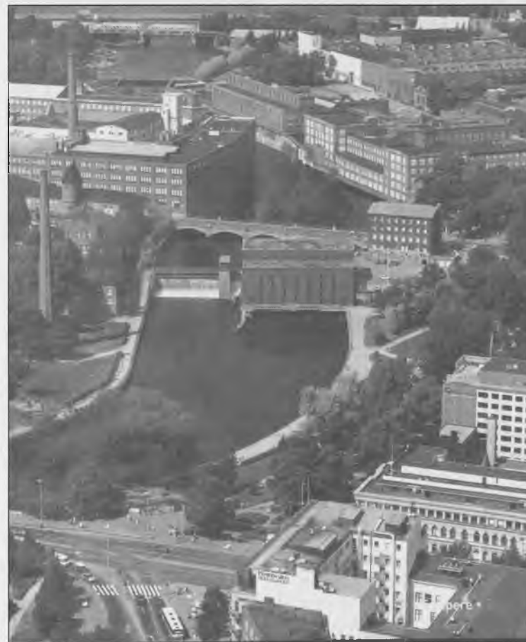
Una veduta aerea della città Finlandese di Tampere

questa Confederazione sindacale italiana voglia trasmettere il proprio essere sindacato ad un'opinione pubblica più generale rispetto ai propri iscritti sapendo ben utilizzare le risorse dell'informatica e della video documentazione.