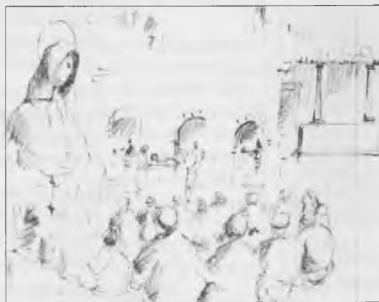
S.Margherita protegge il CALCIT

siderazione, il CALCIT procede nei suoi modesti programmi, con il solo ed unico scopo di permettere la conquista, attimo per attimo, di posizioni di privilegio nella lotta quotidiana contro le barriere del male.