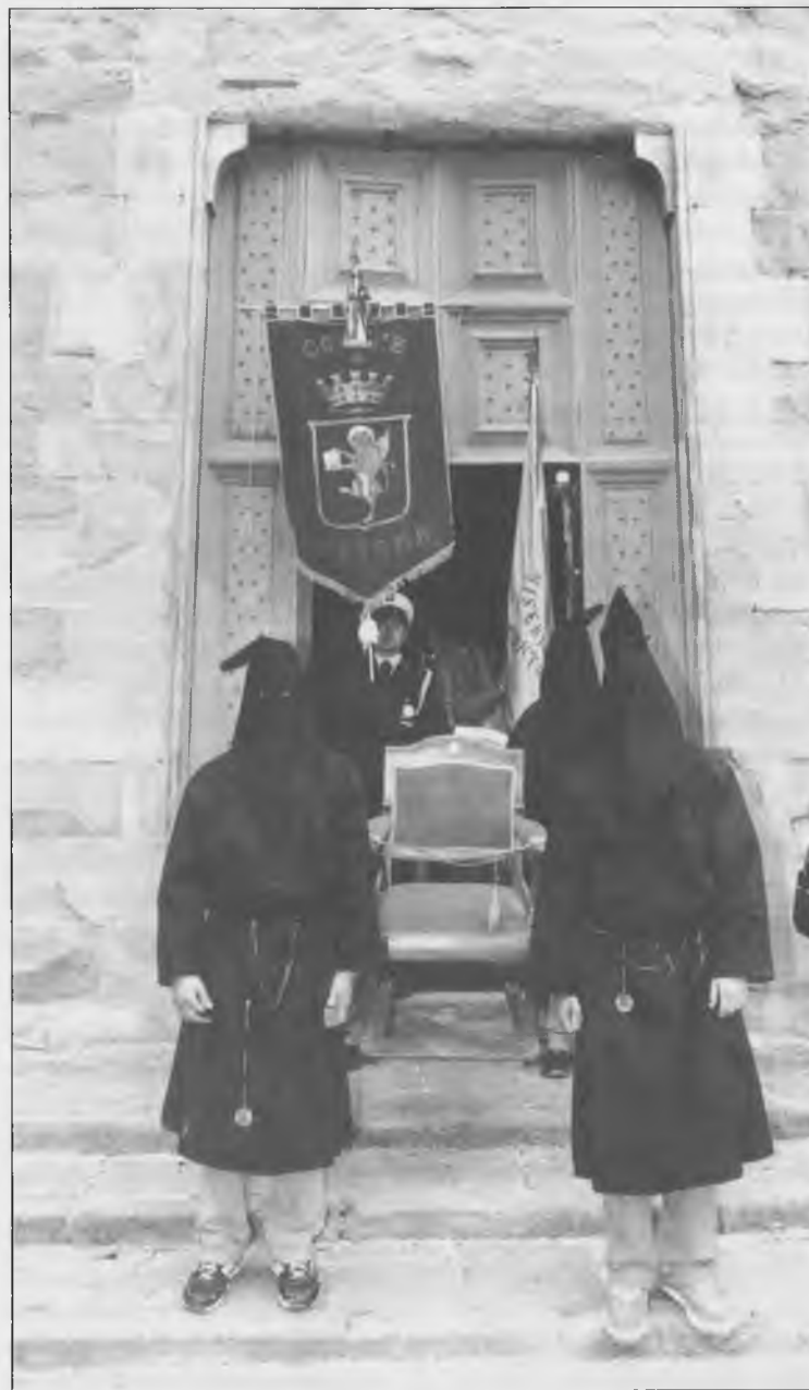
La vecchia sedia porta-infermi