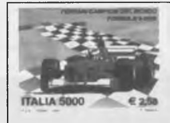
2001 - Ferrari campione del mondo di Formula 1

Come promesso nel precedente servizio, parleremo in particolare delle edizioni dei Cataloghi filatelici, che hanno visto la luce a Riccione, per quanto riguarda l'area italiana, ed a Ravenna, per quelli dell'area europea.