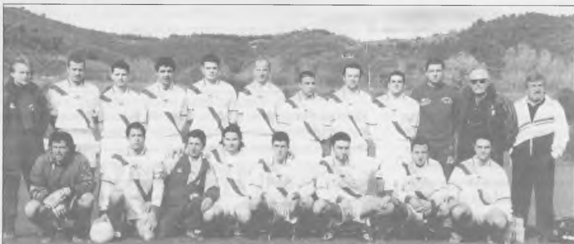
G.S. Terontola - Campionato Toscano Seconda Categoria Girone N - Anno di fondazione 1963

Ristorante serale - Su prenotazione aperto anche a pranzo