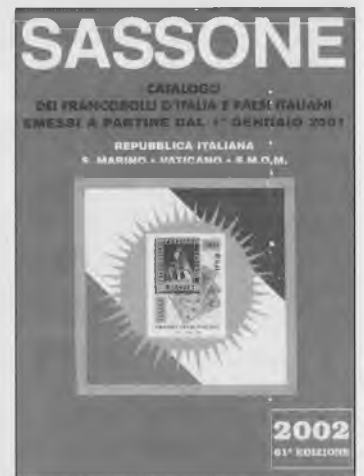
Copertina catalogo SASSONE 2002

La nostra rubrica continuerà passando in rivista altri cataloghi, ma in maniera più veloce, perché in realtà sappiamo tutto di cosa siano queste edizioni filateliche.