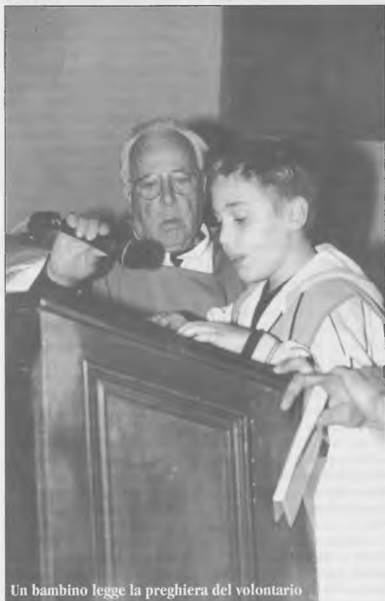
Un bambino legge la preghiera del volontario

V.le G. Matteotti, 95 Tel. 0575/62694 - Cell. 335/6377866 52044 Camucia (Arezzo)