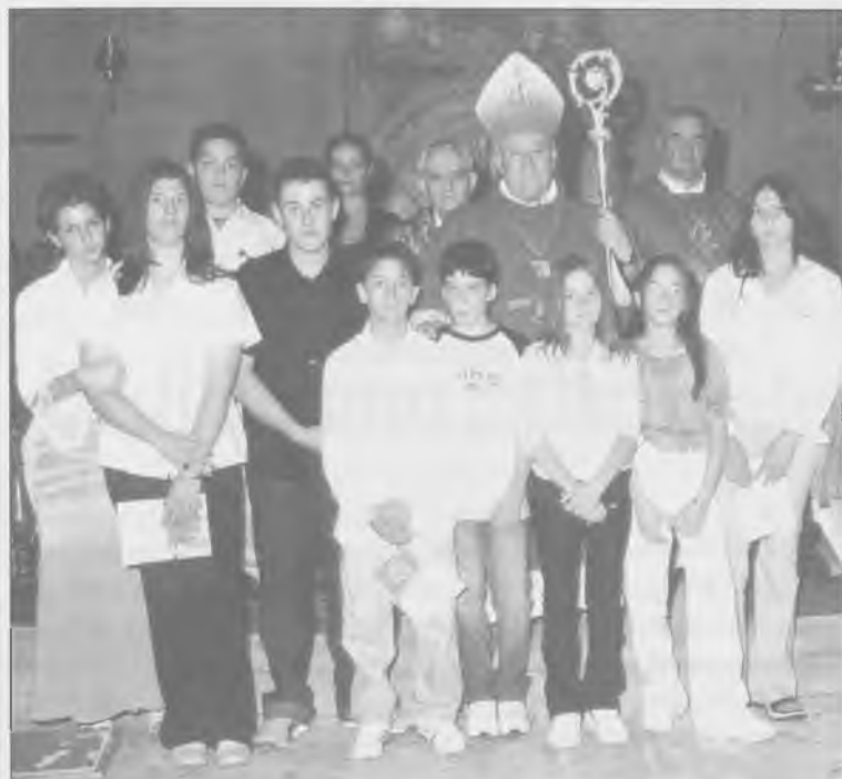
I ragazzi della Cresima con il Vescovo e i Sacerdoti.