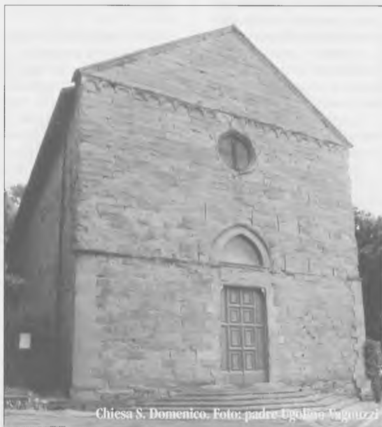
Chiesa S. Domenico.