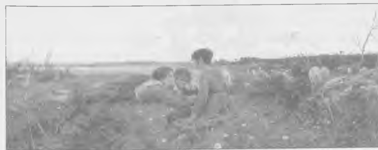
Francesco Gioli - "Primavera", 1879. (Cassa di Risparmio di Firenze)

Aderì al movimento anche Silvestro Lega, pur senza rinunciare mai interamente alla delicata ingenuità della sua particolare visione, un po' venata di Romanticismo. Si vedano, a questo proposito, la Visita in villa (Roma Galleria d'Arte Moderna) il Pergolato della Pinacoteca di Brera; opere ambedue