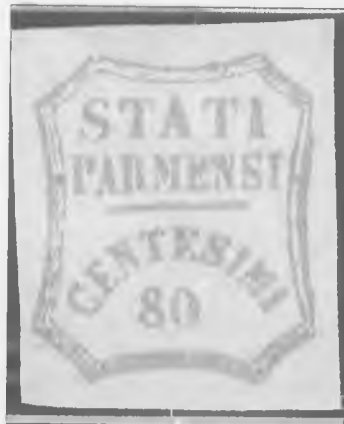
1859 - Emissioni di Parma 80 c. bistro - valutazione 2003: Euro 15.550,00

Ci siamo lasciati, mentre ci preparavamo a raggiungere Riccione, per celebrare di persona il cosiddetto "Capodanno Filatelico", occasione unica nell'anno, in cui le maggiori case tipografiche del settore presentano il loro gioiello "il catalogo", croce e delizia dei filatelici; direi, anche quest'anno "delizia" per i collezionisti, che vedono in linea di massima, impinguare il loro capitale, in media di un buon 15%.