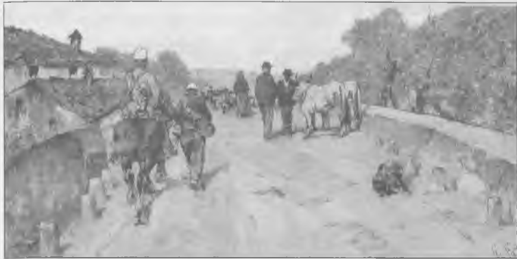
Giovanni Fattori - "Soldati su strada di campagna", 1890. (Cassa di Risparmio di Firenze)

della duttilità tipica del movimento. Ognuno dei Macchiaioli, per quanto agli altri legato da ideali comuni, interpreta l'arte con spirito di assoluta libertà, senza in nulla sacrificare la propria visione; ognuno risolve a suo modo gli