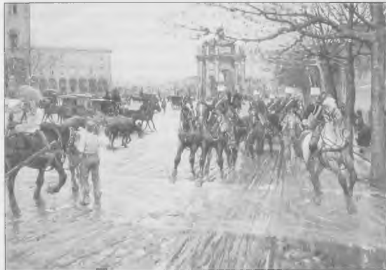
Ruggero Panerai - "Il passaggio dei cavalleggeri in Piazza San Gallo a Firenze". (Cassa di Risparmio di Firenze)

senso di profonda umanità: si sente che l'artista è vicino allo spirituale significato delle cose, partecipa con animo puro, quasi religioso alla tristezza universale che muove dalla ferrea legge del lavoro e della sofferenza.