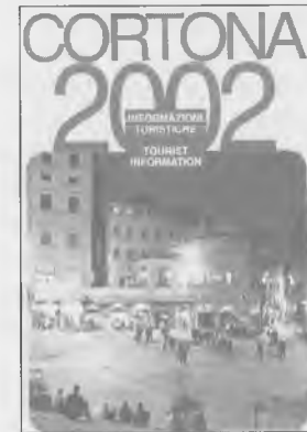
Cortona (Piazza della Repubblica)

Venerio Cattani, Teodoro Re di Corsica Bietti Editore. Euro 10.