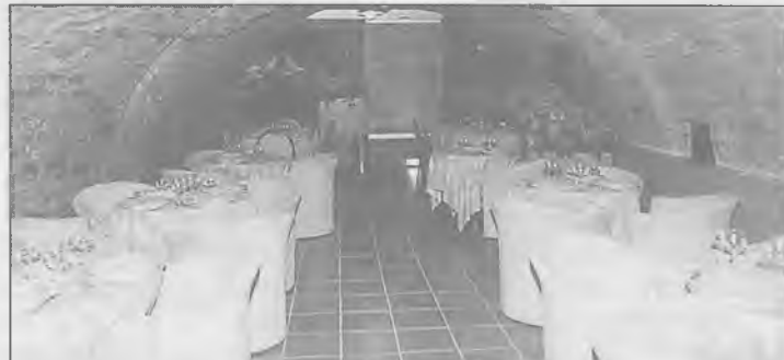
Ristorante serale - Su prenotazione aperto anche a pranzo

Via Ghibellina, 9 - Cortona (Ar) Tel. 0575/630254 - 62076