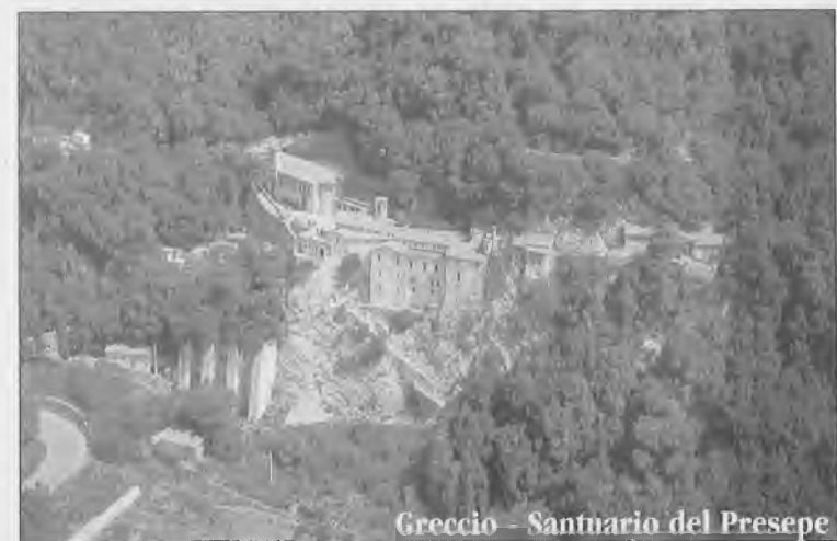
Greccio - Santuario del Presepe

Era la notte del 25 dicembre 1223 un festoso scampanio svegliò tutta la valle Reatina. Dai paesi e dai casolari della campagna uscì una fiumana di gente, devota e curiosa. Vedendo i frati