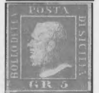
1859 - Sicilia, effigie di Ferdinando II. Bolli della posta di Sicilia da 1/2 grana Euro 1.100,00. 2 grana Euro 250,00. 5 grana Euro 1.250,00

Questo è solo un semplice aspetto di quel periodo molto agitato, che indica i primordi della politica italiana; ma come si può notare, la posta è stata ancora una volta un magico anello di congiunzione fra quelli che soffrivano nelle trincee ed i familiari trepidanti a casa!