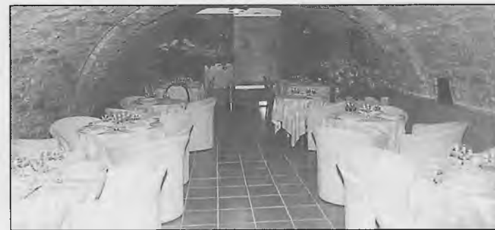
Ristorante serale - Su prenotazione aperto anche a pranzo

Via Ghibellina, 9 - Cortona (Ar) Tel. 0575/630254 - 62076