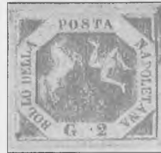
1858 - Napoli, stemma delle Due Sicilie. Bolli della posta napoletana da 1/2 grana Euro 3.150,00 2 grana euro 550,00

Storicamente siamo arrivati al 1860, anno in cui Garibaldi in Sicilia (allora Stato Pontificio), compì la sua grande impresa, contro cui la Monarchia, cercando di bloccare la marcia del condottiero verso Roma, inviò il proprio esercito; vincendo la battaglia di Castelfidardo contro l'esercito papalino, le truppe sarde invasero Marche e Umbria ed il 12 ottobre si congiunsero all'esercito garibaldino.