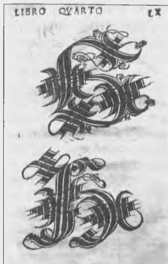
G.B. Verini (1527)

All'origine, anche in questo caso, c'è un mito: è quello di Aracne, fanciulla abilissima nel tessere, che per avventura sfidò la dea Atena, anch'essa notoriamente esperta nel settore. Chissà come, le mani di Aracne dettero vita ad un intreccio insuperabile