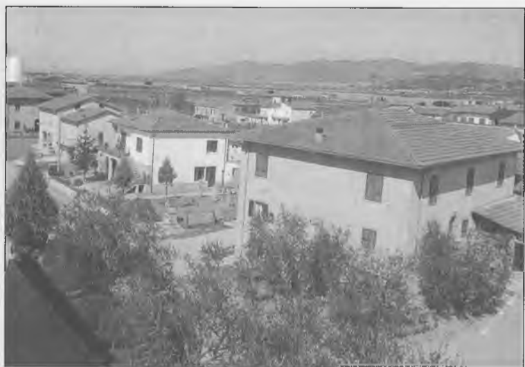
Il centro abitato di Fratta

Anche le persone più "lontane" dalla chiesa e restie alle preghiere, chinavano il capo e recitavano almeno un