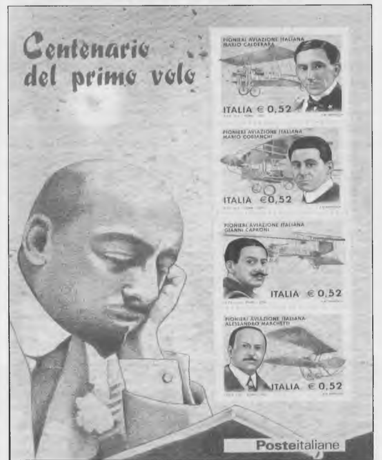
Italia - 2003. Centenario del primo volo

Una volta tanto sono d'accordo col Ministero, perché in realtà è solo un