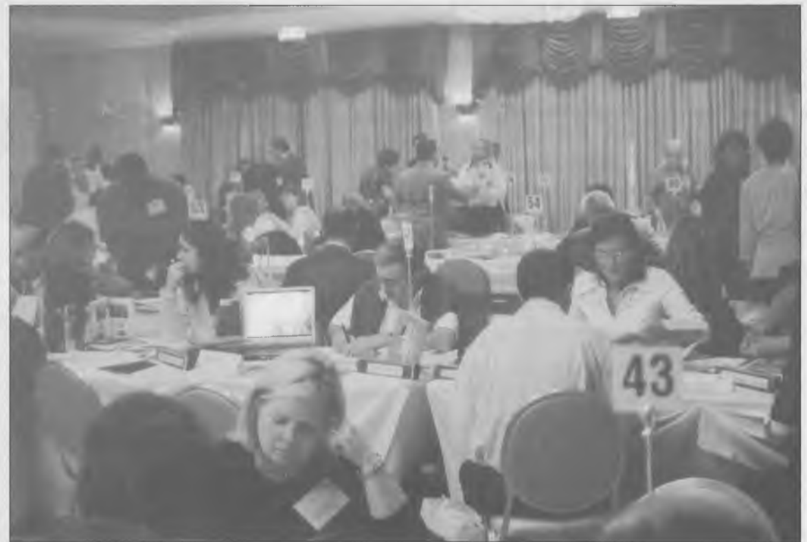
Un momento importante del Workshop con tanti tours operators ai tavoli del Consorzio Operatori Turistici