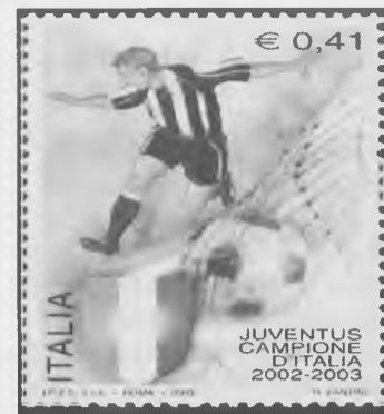
Italia - 2003. Juventus, Campione d'Italia 2002-2003