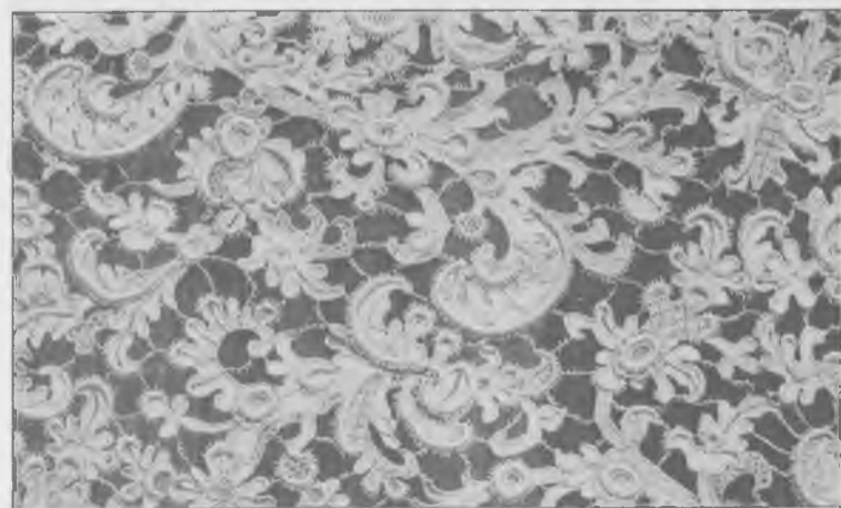
Grande frammento, sec. XIX