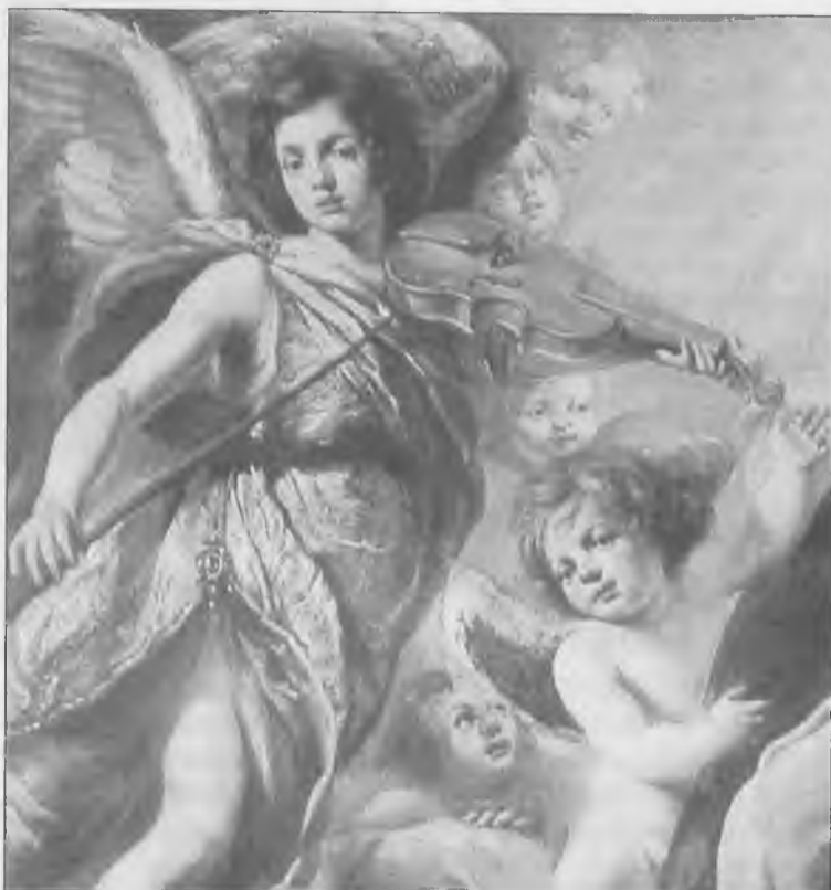
Bernardino Santini. Estasi di S. Francesco (particolare), 1634, Arezzo, Chiesa di S. Francesco

moniare la presenza e la traccia profonda di Pietro oltre ogni commento.