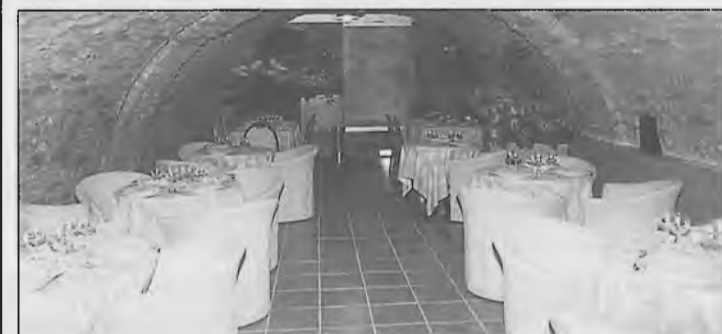
Ristorante serale - Su prenotazione aperto anche a pranzo

Via Ghibellina, 9 - Cortona (Ar) Tel. 0575/630254 - 62076