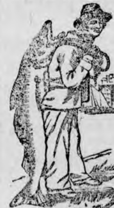
MARCA DI FABBRICA EMULSIONE SCOTT