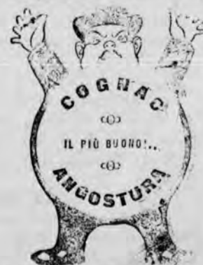
Fiascone di saggio Cini 50 franco nel regno. Invi o raccomandato con tuo cart. Vaglia da 0,50 alla Ditta VINCENZO MARGHERI - FIRENZE

I commercianti, gli industriali e tutti coloro che vogliono migliorare i propri interessi si servano sempre della pubblicità dell' "Etruria", che è uno tra i più accreditati e diffusi periodici della provincia di Arezzo. Prezzi discreti. Abbonamenti speciali per più inserzioni.