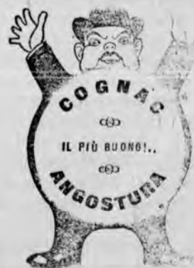
Fiascone di saggio. Cont. 50 cent. nel regno. Invia ra comanda con iro cart. Vaglia da 0,50. Valore: 455.364. 1.10.12

ABBONAMENTI Anno L. 3,50 Semestre L. 2,- Trimestre L. 1,25 RICORDARSI che gli abbonamenti si pagano sempre anticipati. Gli abbonati di fuori si rivolgono agli uffici postali, o all'Amministrazione dell'Etruria, via Berrettini n. 7. TIPOGRAFIA DELL'ETRURIA