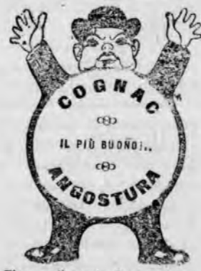
Fiaccone di saggio C.m. 50 franco nel regno. Invio raccomandato contro cart. Vaglia da 0,50 alla Ditta VINCENZO MARGHERI - FIRENZE

I commercianti, gl'industriali e tutti coloro che vogliono migliorare i propri interessi si servano sempre della pubblicità dell' « Etruria », che è uno tra i più accreditati e diffusi periodici della provincia di Arezzo. Prezzi discreti. Abbonamenti speciali per pubblicità.