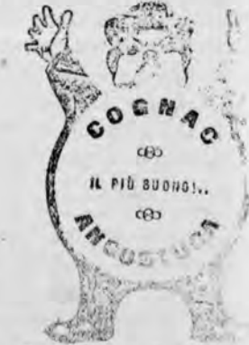
Fiaccone di segno C. Uscatelo nel regno. Invia raccomandato con cart. Vaglia da 0,60 alla D. VINCENZO MARGHERI - FIRENZE