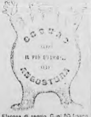
Flacone di saggio. Cuni 50 franco nel ragn. Invio raccom. no cart. Vaglia da 0,80 alla Ditta VINCENZO MARCHESI - FIRENZE