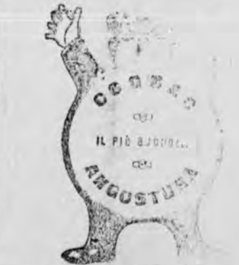
Fiascone di saggio. Cavi 50 centesimi nel regno. Invece raccomanda... tre parti. Vaglia da 0,60... DOMENICO MARZUOLI - FIRENZE

Questa affermazione infatti ci porta a considerazioni di altissima importanza in riguardo a tutti i prodotti agricoli, ed appare assai curiose, anche all'occhio del neofita, la più sicura guida alle ricerche biologiche dei due grandi Regni della natura, animale e vegetale, avvenuta ancora a fenomeni troppo spesso trascurati dai più, i