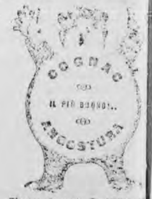
Fiaccone di saggio Comi 50 cent. nel ragn. Invece da comprare in tre carti. Vaglia da 0.22 alla Ditta MARCONI S. BENEDETTO - FIRENZE

INTERESSANTE I commercianti, gli industriali tutti coloro che vogliono migliorare i propri interessi si servono sempre della pubblicità dell' "Etruria", che è uno tra i più accreditati e diffusi periodici della provincia di Arezzo. Prezzi discreti Abbonamenti speciali per più inserzioni.