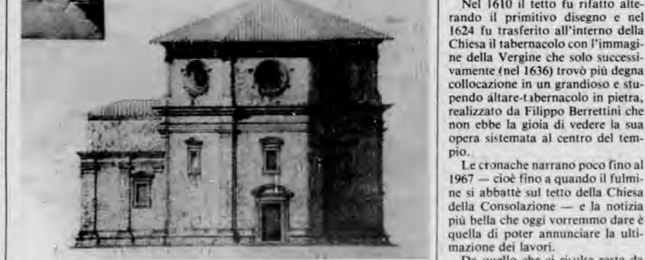
LA CHIESA DI S. MARIA DELLA CONSOLAZIONE

Giaci che il tutto ho visto con mio disugusto". Nel 1640 il tetto fu rifatto alterando il primitivo disegno e nel 1624 fu trasferito all'interno della Chiesa il tabernacolo con l'immagine della Vergine che solo successivamente (nel 1636) trovò più degna collocazione in un grandioso e stupendo altare-tabernacolo in pietra, realizzato da Filippo Berrettini che non ebbe la gioia di vedere la sua opera sistemata al centro del tempio.