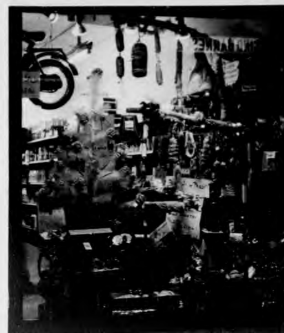
Supermercato 2000 - 1° Classificato