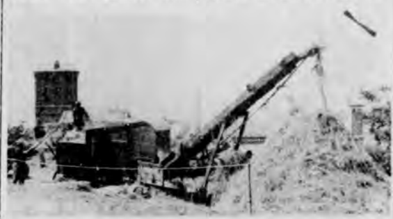
Un momento della battitura all'antica

Dopo la celebrazione della Festa della Montagna che alla sua Xa edizione ha avuto uno