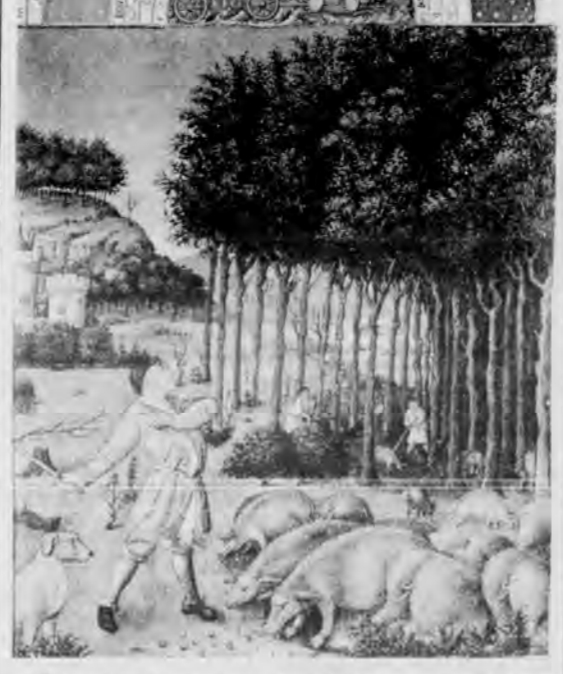
I porcari, nell'alto medioevo, per la più erano servi, come la maggior parte dei lavoratori ai pari delle terre, essi appartenevano ai signori, ai "botentes" che disponevano delle loro persone e dei loro lavori. Quando il re o altri personaggi donavano terre agli enti religiosi (la casa, allora, era frequente); nella donazione erano compresi anche gli uomini che quelle terre lavoravano o su quelle terre pascolavano. Ad esempio, nell'anno 761, re longobardi Desiderio e Adelfo fecero una donazione al monastero bresciano del Salvatore, comprendenti, oltre alle terre, quattro pastori, due dei quali addetti alla cura dei maiali. (...) (dal catalogo della mostra)

SENTA E DOCUMENTAZIONE DELLA FAMIGLIA CORTONA