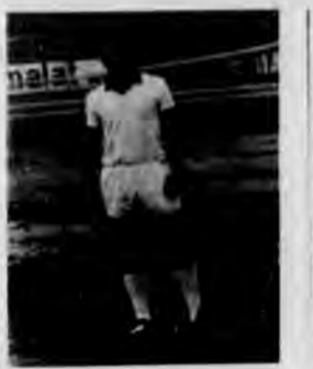
Ghiandai nuovo acquisto della Bunesse ha esordito in coppa con un goal.