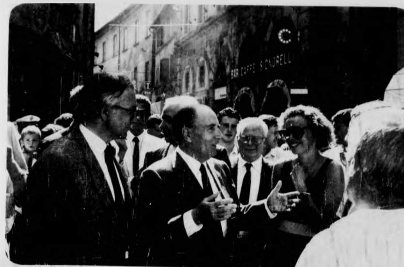
Settembre '87. Mitterand tra autorità e cortonesi

È tempo di vacanze e di viaggi ed unendo utile al dilettevole una numerosa rappresentanza di Cortonesi, si appresta a rendere visita agli amici della Città gemella di Chateau-Chinon, nella ininterrotta tradizione di scambi culturali di esperienze e di amicizia.