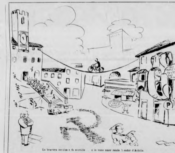
Gia nella notte del 15 agosto 1952 come scrive

Questa esigenza che nasce certamente per una configurazione particolare del terreno circostante le antiche mura etrusche, ha avuto sempre l'attenzione dialettica, mai la volontà politica di risolvere il problema.