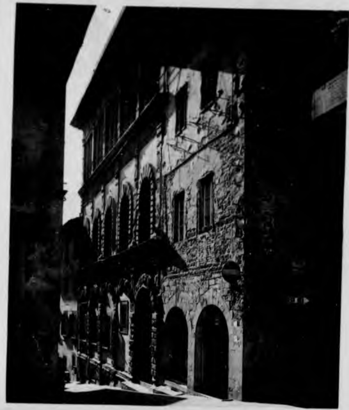
Palazzo Mancini-Sernini (Cristofanello) XVI sec. Sede della Banca Popolare di Cortona