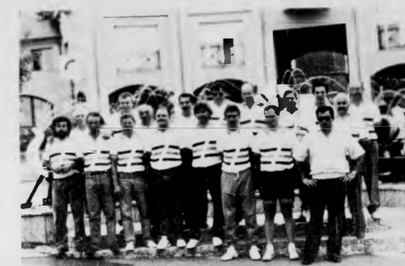
I ciclisti cortonesi a Château-Chinon SERVIZIO A PAGINA 14