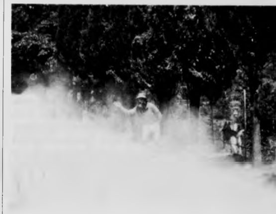
Un giovane studente americano si gode la passeggiata Torreone-Rotonda del Parterre. Da notare il verde dei cipressi soffocati dalla polvere.

Già in un'altra occasione avevamo pubblicato delle foto che esprimevano la protesta per la condizione disagiata della strada che dal Torreone porta ai campi da tennis.