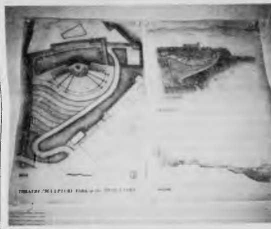
Nella foto una proposta di teatro aperto nel terreno sottostante la Fortezza. Gli studenti americani hanno voluto seguire anche i dislivelli del terreno. È una proposta interessante.