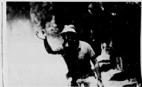
Lo stesso giovane sembra dire: "se l'acchiappo..."

La situazione attuale certamente non giova neppure alla struttura sportiva.