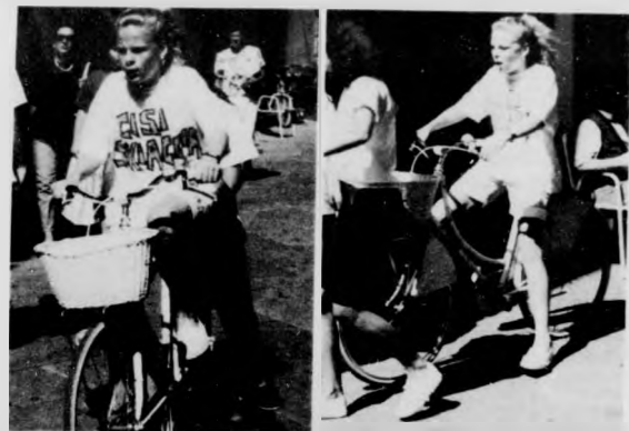
Bicicletta in Ruga Piana