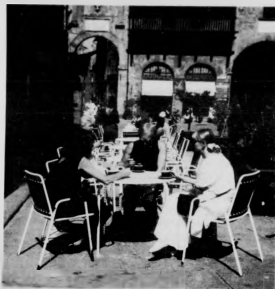
Tintarella in Piazza del Comune

In questo mese avranno luogo due Eclissi: nella Luna al 17 e del Sole al 31. Questo accompagnerà un periodo di insoddisfazione soprattutto per le persone più serie e preparate che saranno messe in ombra da altre che improvvisano con superficialità e presunzione. Le manifestazioni a carattere popolare si svolgeranno con ordine e con calma; i risvolti commerciali saranno buoni ma richiederanno molto lavoro minuto e cura dei particolari.