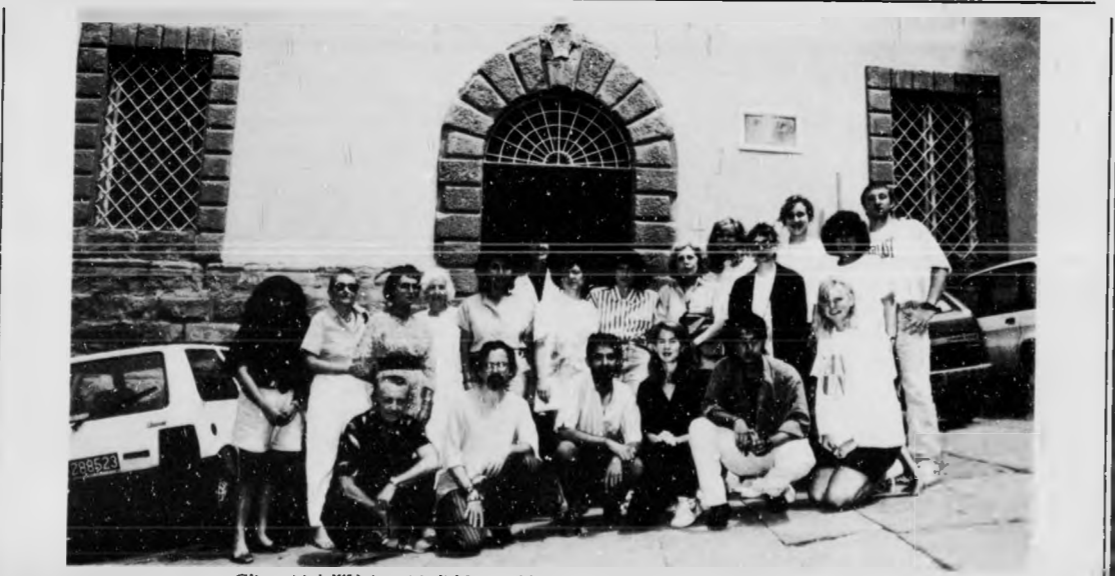
Gli ospiti dell'Università di Miami (Florida) nella foto-ricordo di pochi giorni fa.

Prima di Ferragosto sarete piuttosto stanchi e demotivati, ma in seguito le condizioni fisiche miglioreranno. Comunque non abbandonate le precauzioni o le cure adeguate alla vostra situazione. Verso fine mese si profila un cambiamento nell'ambiente di lavoro: persone che si avvicendano e lasciano a voi i loro problemi irrisolti. Non date avvio a vertenze legali e cercate soluzioni di compromesso.