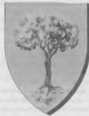
(Nella foto il blasone civico di Château Chinon)

Château Chinon ricorda da vicino la gemella Cortona, posta com'è sulle pendici boschive di un colle, a circa 600 metri di altitudine.