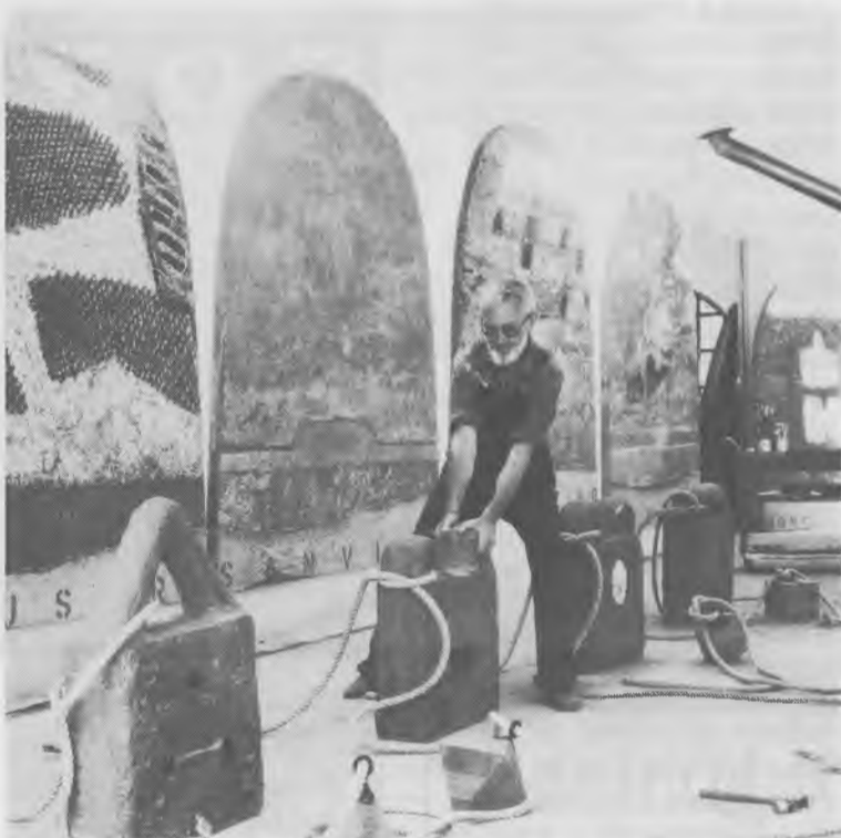
DA PAGINA 1