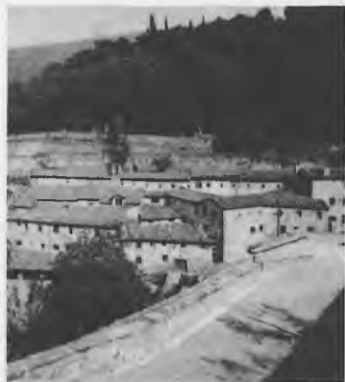
Questo "Francesco" è naturalmente quello di Assisi, e parlare di lui come "attuale" significa che

egli ha tanto da dire su molti problemi del nostro tempo non sempre risolti. Questa corrispondenza quindicinale proviene da "Le Celle" luogo da lui privilegiato.