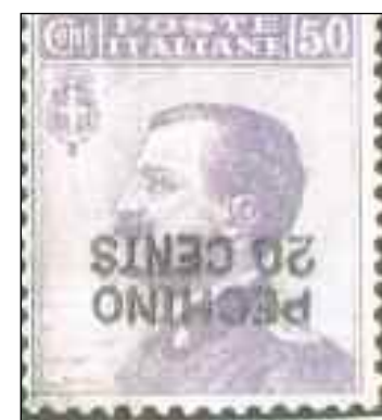
1917 - Michetti 50 c. con sovrastampa "Pechino 20 cents" capovolta - Sass. n. 6/b - Euro 62.500,00

Ecco come Milanofil 2009 è riuscita a colpire nel segno il centro dell'attrazione filatelica, che da anni fa convergere a Milano una quantità enorme di collezionisti, rendendo il convegno, come quest'anno, una anteprima di lusso a quanto si sta preparando