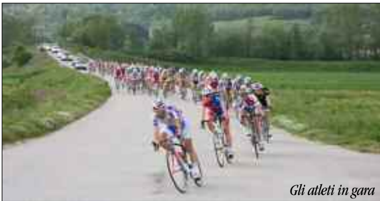
Gli atleti in gara

Il via alla corsa, gratificando con la sua presenza l'impegno e gli sforzi degli organizzatori, è stato dato alle 14,30 dal grande Alfredo Martini, presidente onorario della Federazione Ciclistica Italiana. Novantasette i corridori partiti, tutti appartenenti alle migliori formazioni di Toscana, Umbria, Marche, Lazio e Campania.