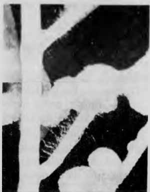
Radici di una leguminosa con i noduli prodotti dalla simbiosi con i rizobi, batteri capaci di fissare l'azoto atmosferico

La tecnica adottata in questi casi si basa sul trasferimento dei geni responsabili della modulazione sulle radici, dai batteri azoto-fissatori delle leguminose ( Rhizobium ) a batteri azotofissatori associati a cereali ( Azospirillum ) in modo da instaurare la preziosa simbiosi nei cereali.