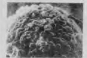
A sinistra la superficie di un nodulo a fianco l'interno di un nodulo. Si nota la grande quantità di rizobi