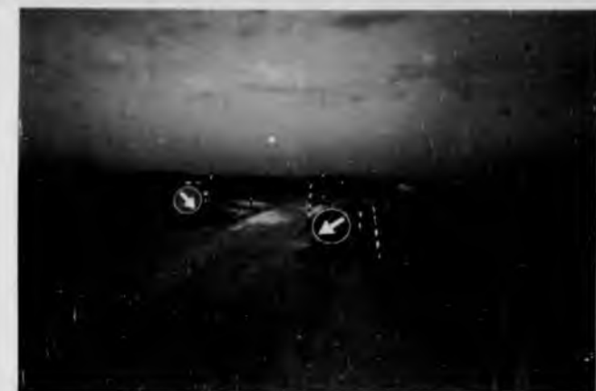
Nella foto: Il ponte nel canale di Montecchio.

Il ponte sul canale di Montecchio, in località Capannacce è stato dichiarato dal Genio Civile pericolante, ed è stato limitato il transito ai solo piccoli e medi veicoli.