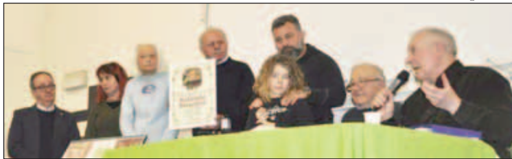
Terontola, 26 marzo: foto di famiglia finale