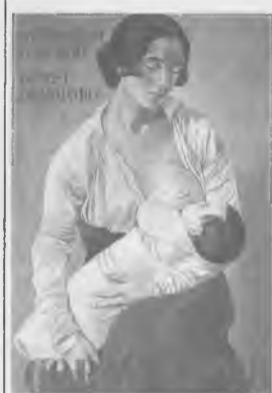
Gino Severini. Maternità 1916, Museo dell'accademia Etrusca (Cortona).

Un incontro con Cortona è un incontro con l'arte, con la storia, con il misticismo